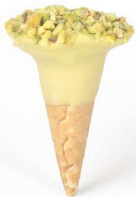
Conetti al Pistacchio con granella Pistachio cones with grains