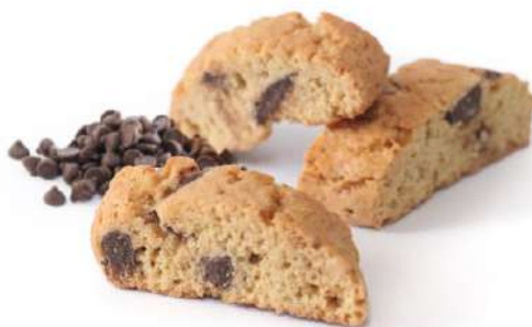
Cantuccini al Cioccolato Cantuccini cookies with chocolate chips