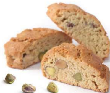
Cantuccini al Pistacchio Cantuccini cookies with pistachios