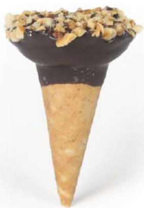
Conetti alla Nocciola con granella Hazelnut cones with grains