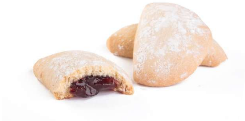
Fagottini alla Ciliegia Cherry jam filled biscuits