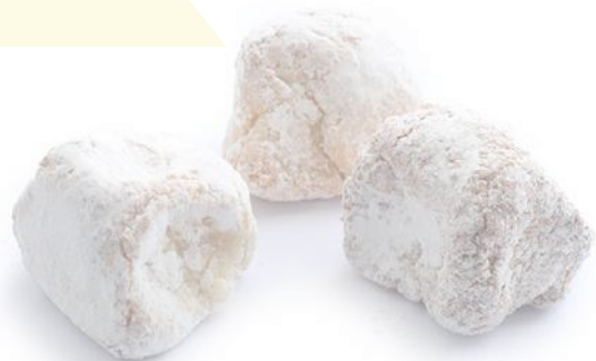
Pizzicotti di Manndorla Siciliana Classic almond biscuits