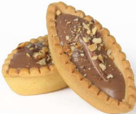
Barchette al Cioccolato con granella di Nocciola Chocolate tart with grains of hazelnut