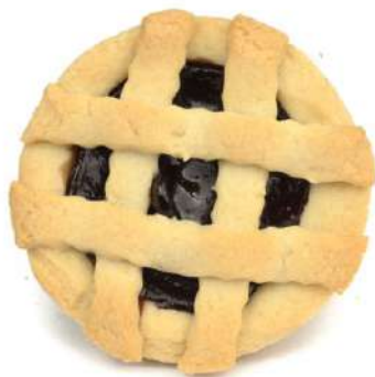
Crostatina alla Ciliegia Cherry jam filled Tarts