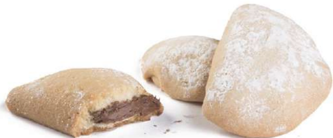
Fagottini alla Nocciola Hazelnut cream filled biscuits