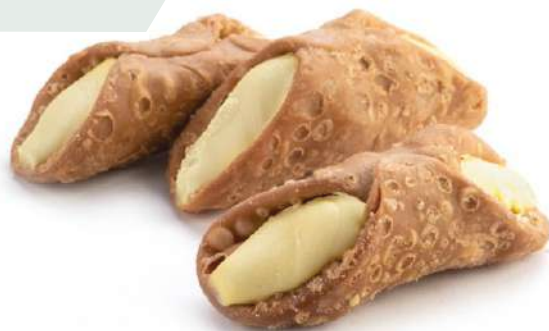
Cannoli al Limone Lemon cream filled Sicilian Cannoli