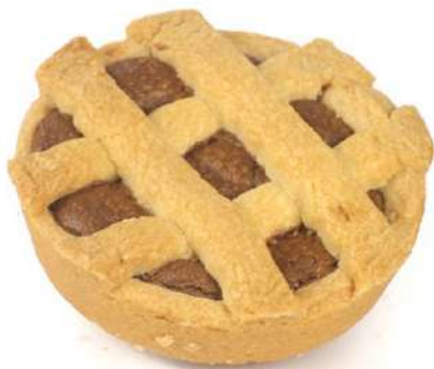
Crostatina alla Nocciola Hazelnut cream filled Tarts