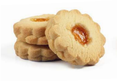
Occhio di Bue all'Albicocca Apricot jam filled biscuits