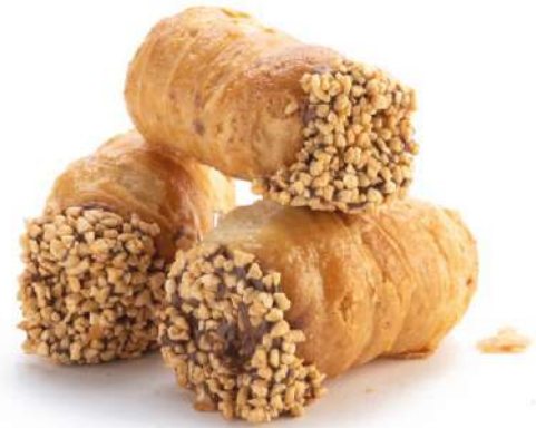
Cannolo Napoletano alla Nocciola Hazelnut cream filled Neapolitan Cannoli