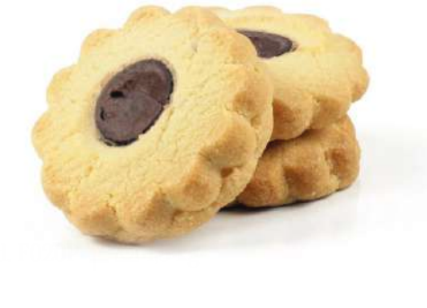
Occhio di Bue alla Nocciola Hazelnut cream filled biscuits