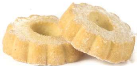
Canestrelli Buttery shortbread cookies