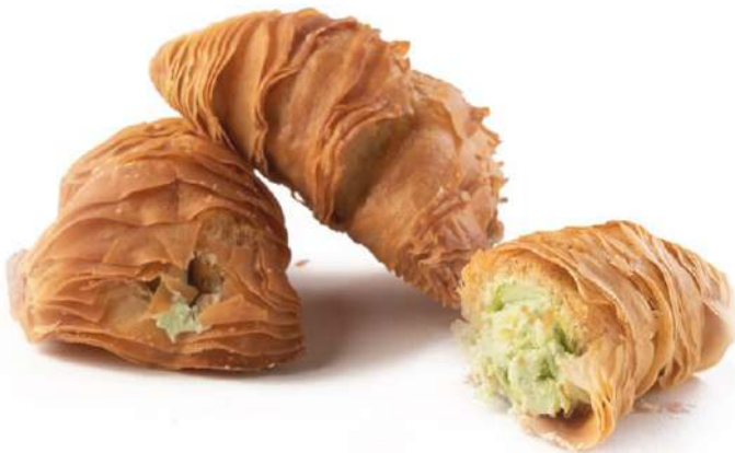
Aragostine al Pistacchio Pistachio cream filled lobster tails "Aragostine"