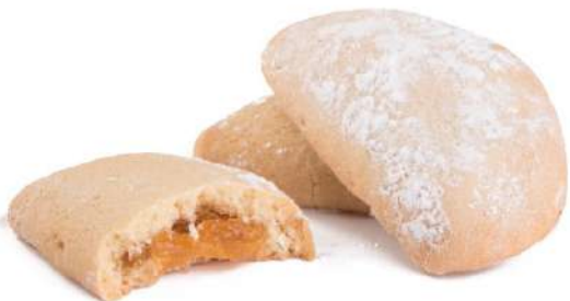
Fagottini all'Albicocca Apricot jam filled biscuits