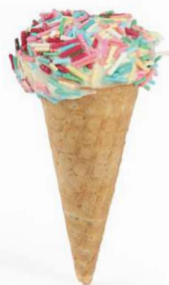
Conetti alla Nocciola bianca con codine White hazelnut cones with sugar sprinkles