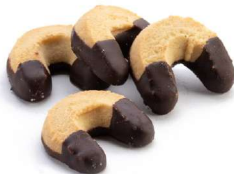
Ferretti al Cioccolato Chocolate-Glazed shortbread