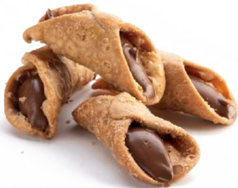
Cannolo Siciliano alla Nocciola Hazelnut cream filled Sicilian Cannoli