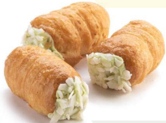
Cannolo Napoletano al Limone Lemon cream filled Neapolitan Cannoli