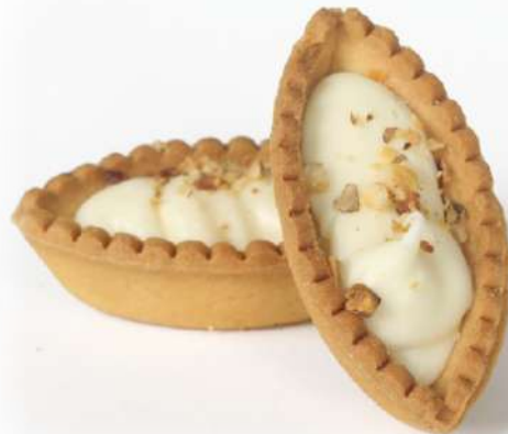
Barchette al Cioccolato Bianco con granella di Nocciola White Chocolate tart with grains of hazelnut