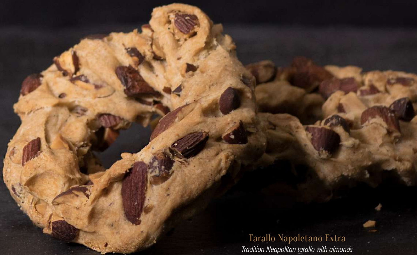
Tarallo Napoletano Extra Tradition Neapolitan tarallo with almonds