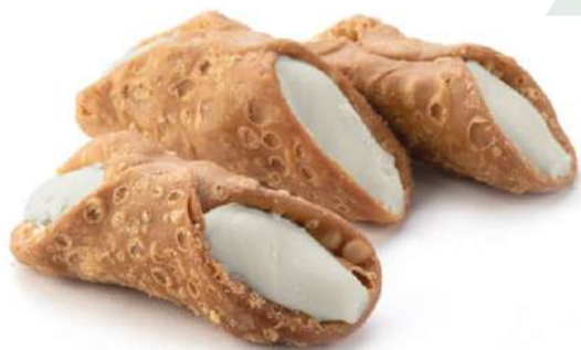
Cannolo Siciliano alla Vaniglia Vanilla cream filled Sicilian Cannoli