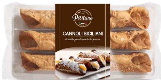
Cialde di Cannolo Siciliano Grandi Sicilian Cannoli shells - big -