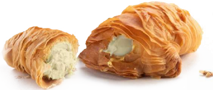
Aragostine alla Vaniglia Vanilla cream filled lobster tails "Aragostine"