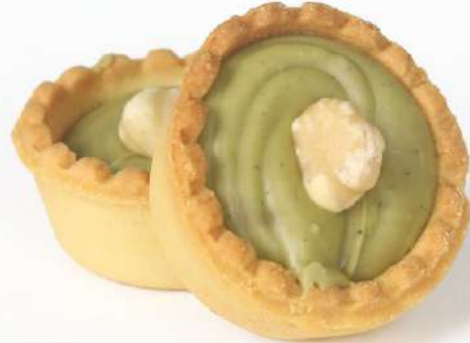
Cestino al Pistacchio Pistachio tarts