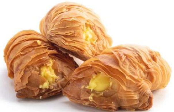
Aragostine al Limone Lemon cream filled lobster tails "Aragostine"