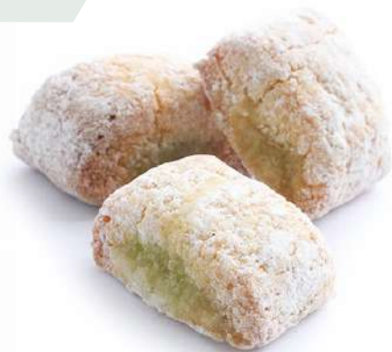
Pasta di Mandorla al Cedro di Sicilia Almond biscuits with candied Ceder