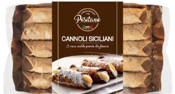
Cialde di Cannolo Siciliano Mignon Sicilian Cannoli shells - mignon