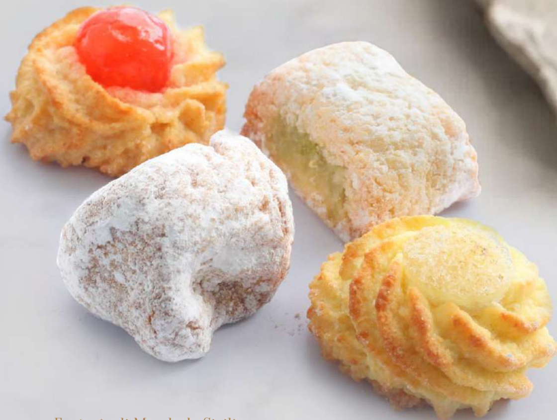
Fantasia di Mandorla Siciliana Assorted Sicilian almond biscuits