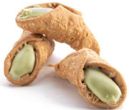
Cannoli al Pistacchio Pistachio cream filled Sicilian Cannoli