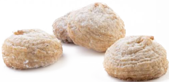
Amaretto morbido Soft almond Amaretto