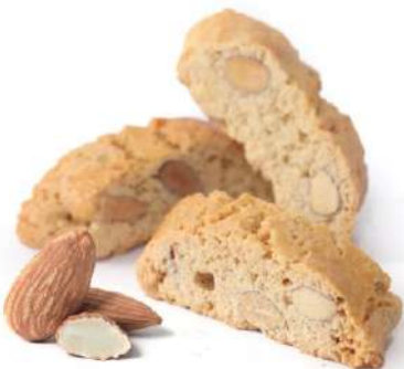
Cantuccini alle Mandorle Cantuccini cookies with almonds