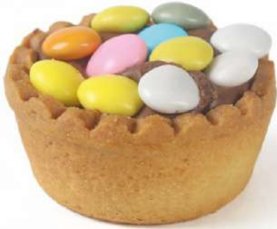
Cestino Smarties Confetti Tarts