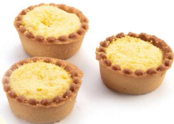
Tartelle al Limone Lemon cream filled mini tarts