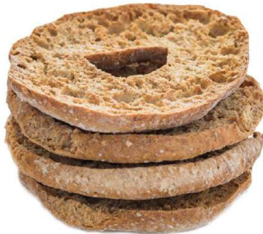
Freselle Integrali Wholewheat Freselle bread