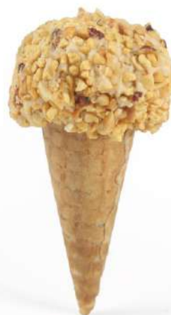
Conetti al Caramello salato con granella Salt Caramel cones with grains