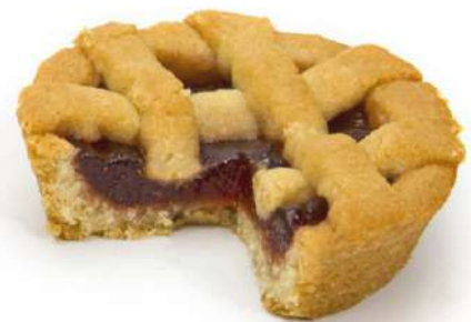
Crostatina ai Frutti di Bosco Wildberries jam filled Tarts