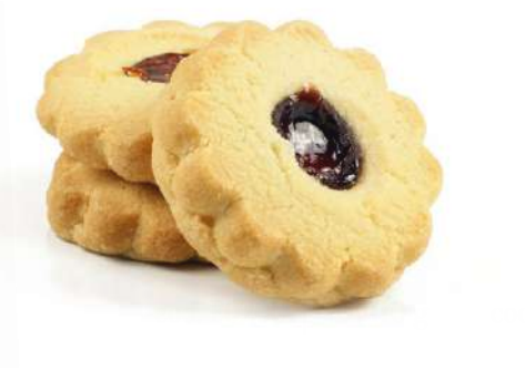
Occhio di Bue alla Ciliegia Cherry jam filled biscuits