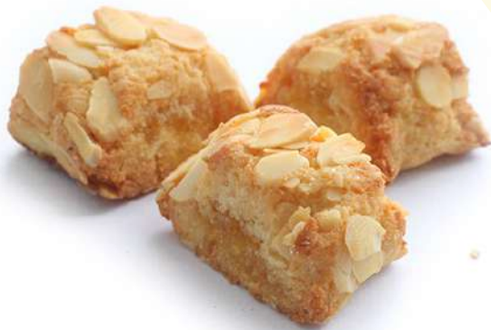
Pasta di Mandorla agli Agrumi di Sicilia Almond biscuits with citrus fruits