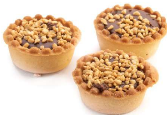
Tartelle alla Nocciola Hazelnut cream filled mini tarts