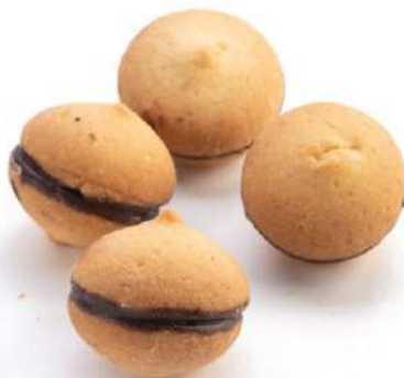
Baci di Dama Classic Lady's Kisses biscuits